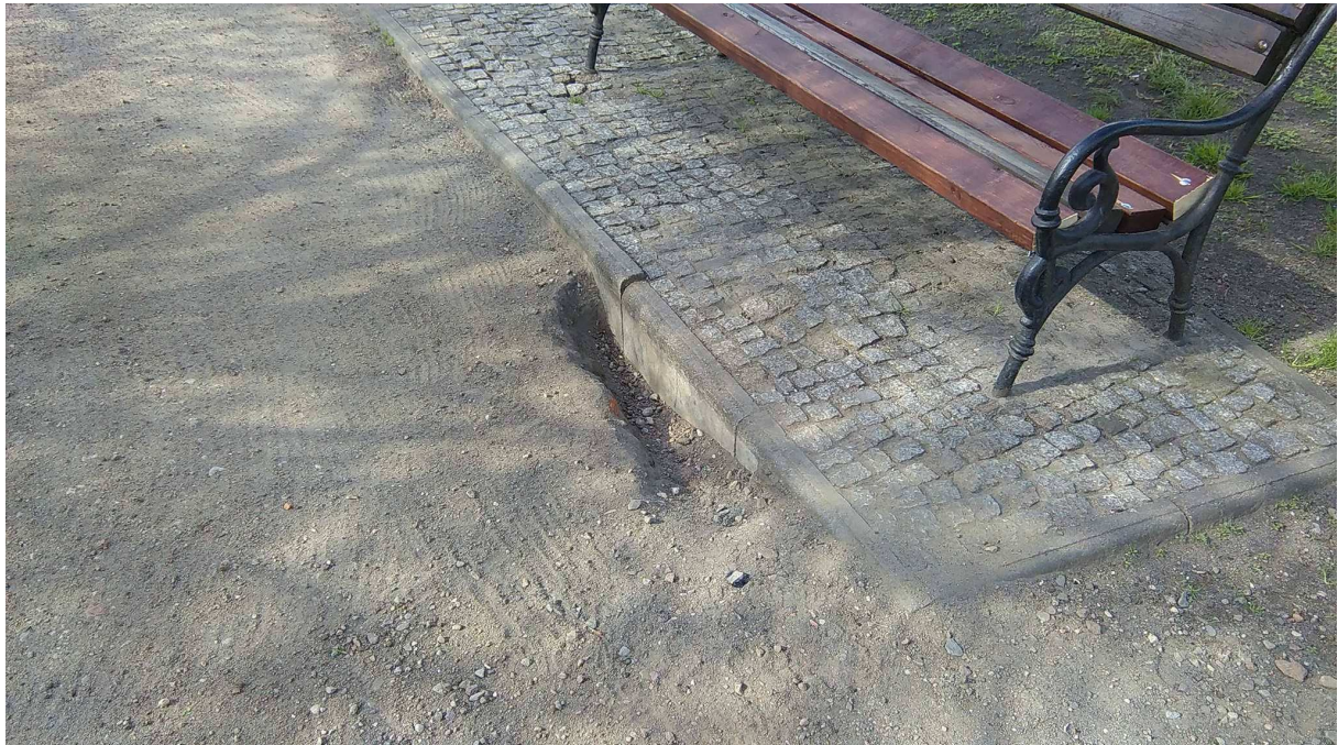
3) naprawę obrzeży alejek z kostki granitowej