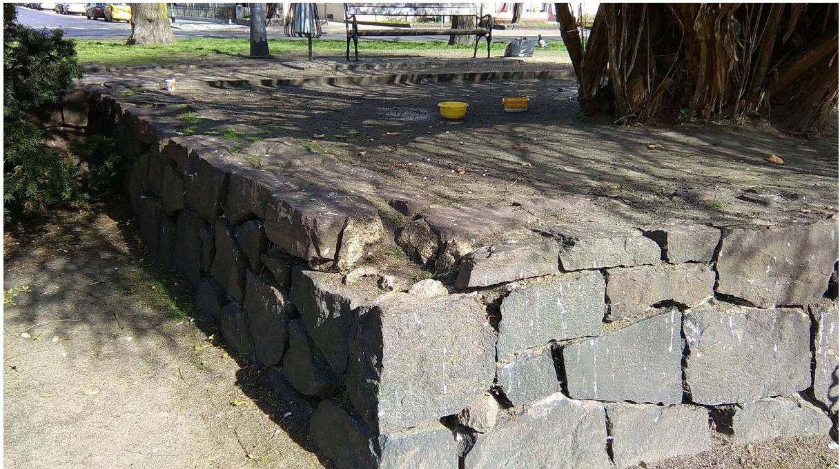
5) wyczyszczenie terenów zielonych z liści, gałęzi oraz kostki granitowej